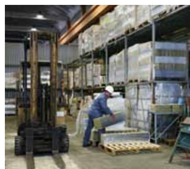
Préparation des livraisons pour le navire