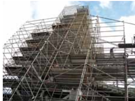
Échafaudage en cours de réalisation