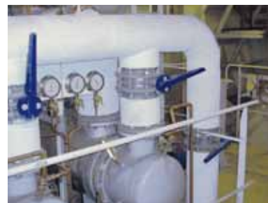
Isolation tuyauterie « Armacal™ » toile de verre enduit