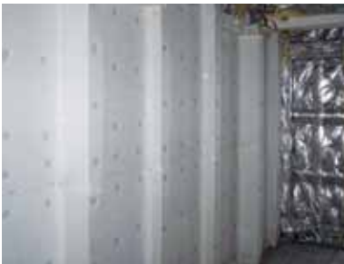
Isolation phonique avec masse lourde « MAPFLEX™ »