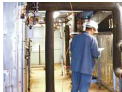
Contrôle de travaux dans une centrale d'air