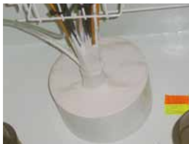
Surbain incendie flammastic