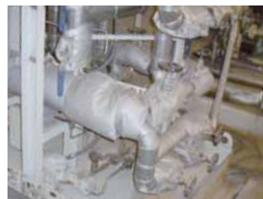
Isolation tuyauterie matelas sur instrumentation