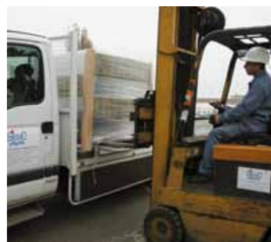
Chargement des livraisons pour le navire