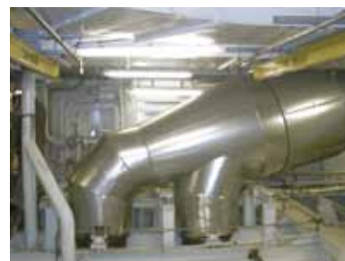
Isolation échappement avec protection tôle des cheminées du navire