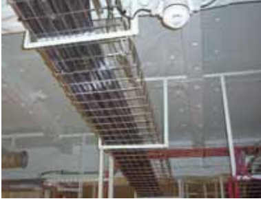
Isolation cloison incendie revêtement « GV »