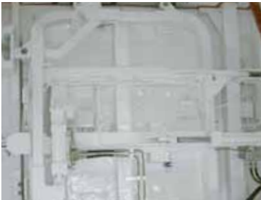
Isolation incendie sur porte de compartimentage étanche