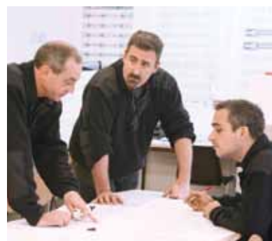
L'Équipe du bureau d'étude

Nous sommes certifiés MASE et Qualibat, mais par mesure d'exigence, nous nous imposons le suivi d'un système d'auto-contrôle assuré par nos poseurs, système auquel vient s'ajouter le travail effectué par nos contrôleurs qualité avant toute présentation aux clients.