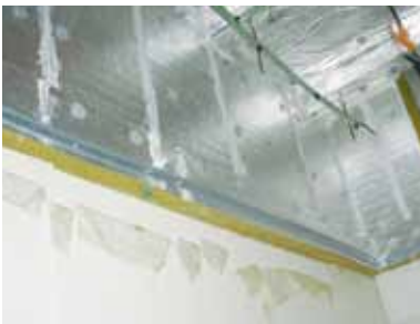
Écran coupe-feu « B15 »