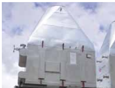
Isolation échappement avec protection en tôle