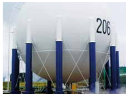
Ignifuge de pieds de sphère