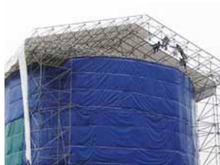
Échafaudage d'une sphère