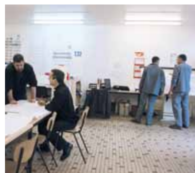
L'Équipe du bureau d'étude