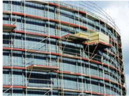
Isolation d'un bac

Notre réactivité et notre disponibilité, grâce à la souplesse d'une équipe à dimension humaine, ont amené nos meilleurs clients (TOTAL, EDF, LE PORT AUTONOME...) à nous confier la gestion de leurs principaux contrats de maintenance. Leur confiance est confortée par notre personnel constitué de professionnels motivés, qui savent assurer des interventions 24h/24.