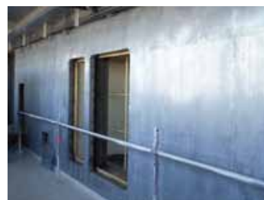
Isolation acoustique avec protection tôle perforée