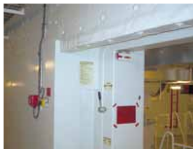
Isolation cloison avec protection tôle blanche