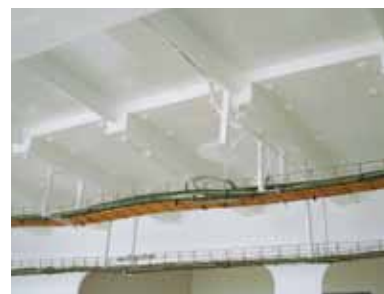
Protection étanche zone extérieure navire dite « FIRECHECK™ » projection enduit à la pompe